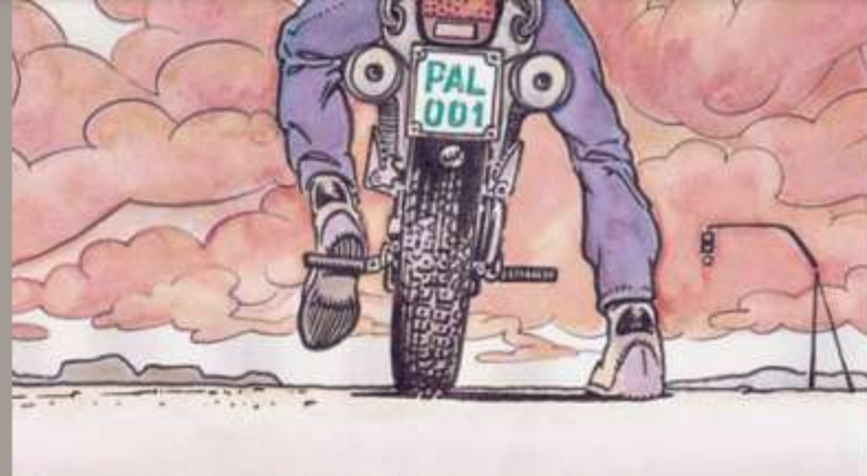
ILLUSTRAZIONE DI ANDREA PAZIENZA

27 MAGGIO - 8 GIUGNO 2025 INAUGURAZIONE 27 MAGGIO ORE 17